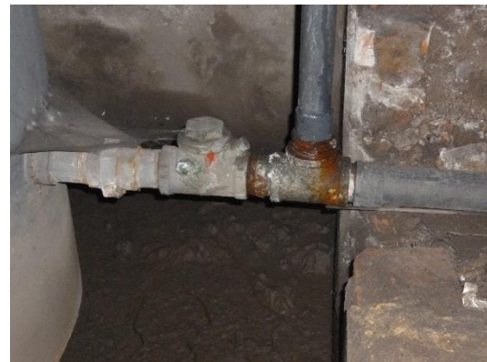
Imagen 7. Descarga del tanque hidroacumulador en material HG.

Adicionalmente el equipo de presión no tiene válvula de corte en la descarga que es necesaria para regular el caudal bombeado y aislar el sistema en caso de mantenimiento o reparaciones, como tampoco tiene otros elementos apropiados en la instalación de esta clase de equipos como juntas de expansión, universales. La válvula en la succión de la bomba es de difícil manipulación por el alto grado de oxidación en el que se encuentra. La válvula de retención en la descarga del tanque hidroacumulador también se encuentra en mal estado lo que puede generar problemas en la descarga al