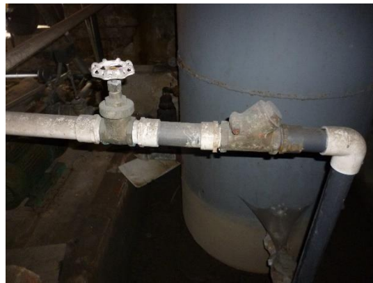
Imagen 2. Válvula de paso directo y válvula de retención en el by-pass del sistema.

Las válvulas de descargar y de paso directo del sistema, son válvulas en hierro y asiento en bronce, de tipo paso directo y pesado, con uniones roscadas como se puede observar en la imagen 2.