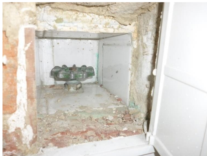
Imagen 14. Válvula embebida en concreto e inoperable.