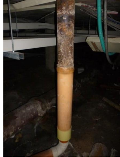
Imagen 36. Empate entre PVC liviana y HF en mal estado y reducción de diámetro en la parte inferior de la bajante.