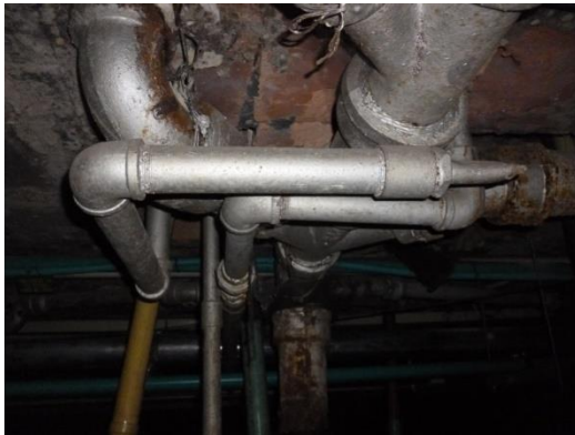
Imagen 21. Redes de aguas residuales en HF deterioradas.