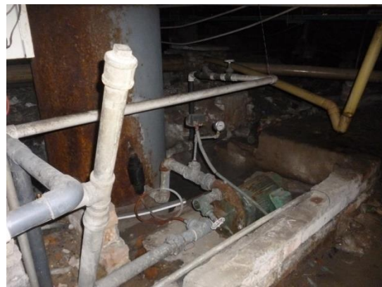
Imagen 4. Válvulas de descarga del sistema.