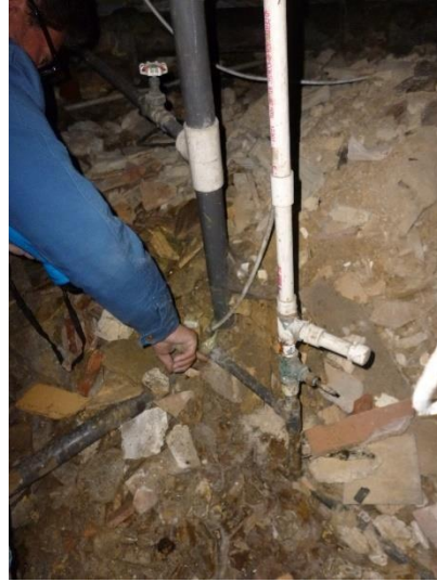
Imagen 10. Redes de suministro en material PVC presión.

Se menciona que la mayoría de las redes están en PVC porque toda la red general desde una parte de la descarga del equipo hidroacumulador, y toda la acometida del acueducto se encuentran en material plástico, al igual que todas las redes de suministro de agua potable de las edificaciones contiguas al edificio central y de administración.