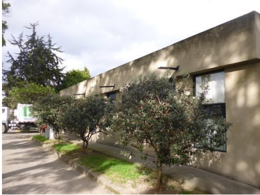
Imagen 42. Gárgolas de rebose que drenan a calzada.