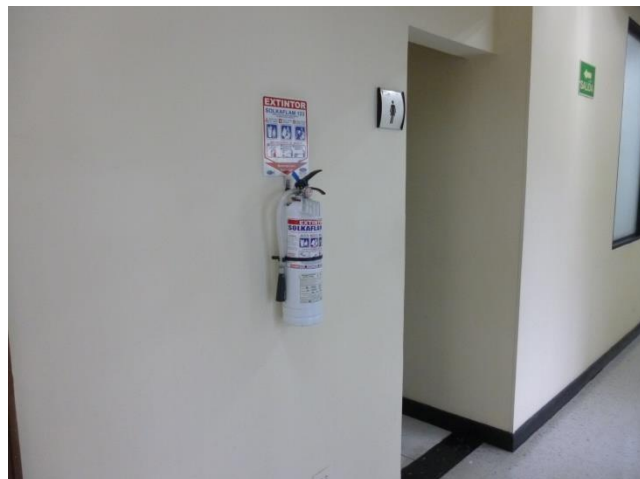
Imagen 49. Extintor Solkaflam cargado y en buen estado.