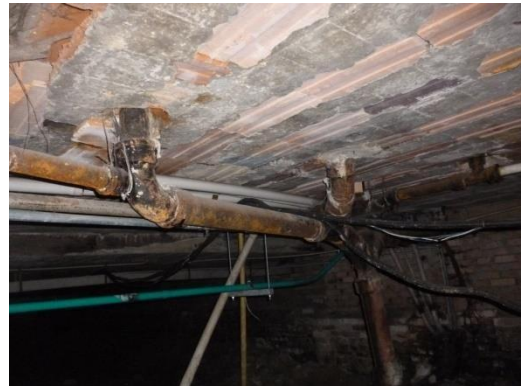
Imagen 24. Redes en HF deterioradas, y mal soportadas.

De igual forma, en el piso técnico del edificio central se encuentran los colectores principales del sistema combinado en material GRES que tampoco presentan buen estado como se ilustra en las imágenes 27 y 28.