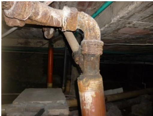
Imagen 23. Redes en HF deterioradas.