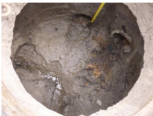
Imagen 44. Pozo de inspección del alcantarillado público colmatado de sedimentos.

En general las redes, cajas y pozos de inspección que reciben aguas residuales y lluvias en sistemas separados, presentan un estado aceptable, pero hay algunos pozos que se encuentran colmatados por falta de mantenimiento, como se ilustra en las siguientes imágenes.