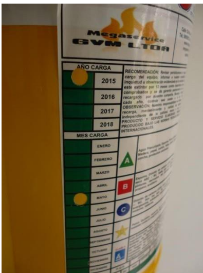
Imagen 48. Extintor ABC cargado y en buen estado.

El edificio tiene extintores en buen estado, y aparentemente ubicados en lugares apropiados, se dice aparentemente, porque un sistema contra incendio con extintores portátiles tiene su respectivo diseño respectivo, no es suficiente para tener un sistema de extinción de incendios que cumpla con las recomendaciones de la normatividad vigente. Los extintores existentes se muestran en las siguientes dos imágenes: