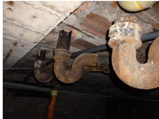
Imagen 22. Sifones en HF en mal estado.