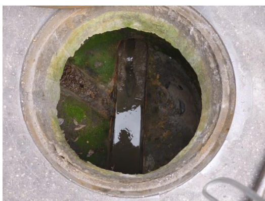
Imagen 46. Pozo de inspección en buen estado.