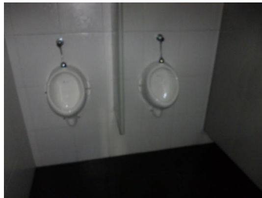
Imagen 20. Orinales en buen estado.

Se recuerda que los aparatos instalados deben cumplir con los requisitos de bajo consumo de la Ley 373 de 1997 y sus decretos reglamentarios. En el levantamiento, no se distinguen modelos, ni marcas, por lo que no es posible saber si son aparatos de bajo consumo.