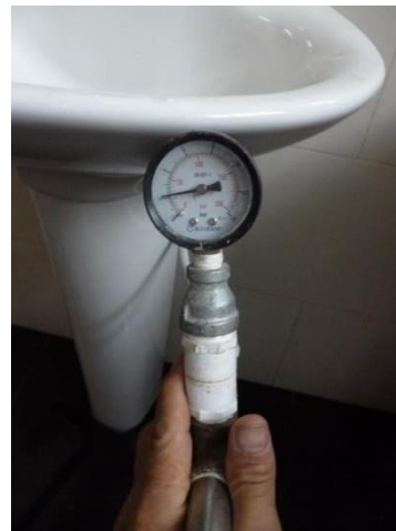
Imagen 18. Toma de presión en baños de segundo piso .