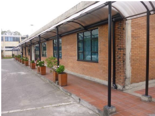
Imagen 40. Conjunto cubierta, canal y bajantes en PVC que drenan las aguas lluvias a calzada.

En los demás edificios del SGC, y como se mencionó en el levantamiento, las redes de aguas lluvias drenan a calzada, ya se mediante manejo de inclinación de cubiertas, o través de canales metálicas y plásticas, o mediante bajantes que se encuentran en material HF y otras pocas en PVC. Ejemplo de drenajes a calzada de las otras edificaciones se ilustran en las siguientes imágenes: