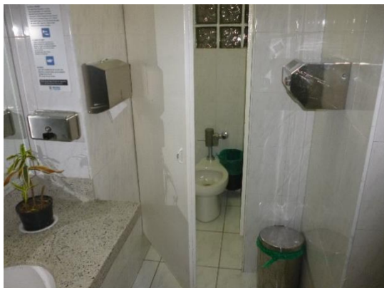
Imagen 19. Sanitario en buen estado.