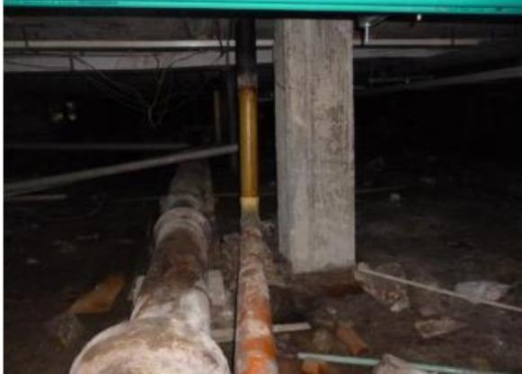
Imagen 35. Conducciones de aguas lluvias en PVC liviana y empate con HF en mal estado.