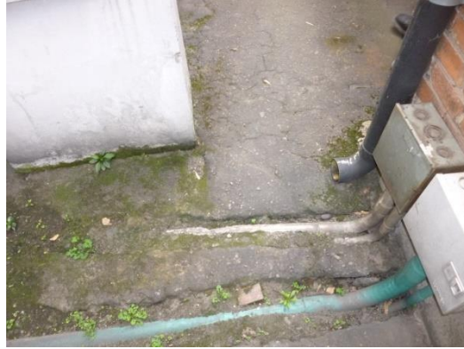
Imagen 43. Aguas lluvias drenadas a piso.

Drenar a calzada, es uno de los sistemas más eficientes para desaguar las aguas lluvias, siempre y cuando se tengan sumideros cerca, y pendientes