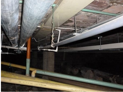
Imagen 9. Redes de suministro en PVC presión ubicadas en piso técnico.