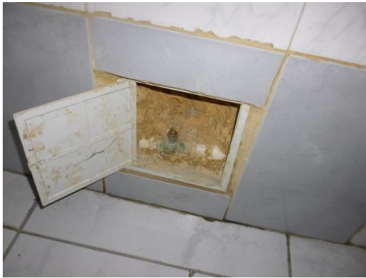
Imagen 15. Válvula embebida en mortero y sin mariposa.

Algo semejante sucede en las válvulas de corte de los otros edificios, a pesar de que sus redes estén en material PVC, es decir, que estén prácticamente nuevas.