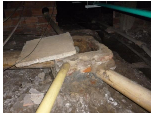
Imagen 32. Caja de inspección con dimensiones pequeñas.

De acuerdo a lo conversado con el personal de mantenimiento, en ocasiones en los baños ubicados en primer piso se presenta taponamiento al momento de descargar algunos sanitarios generando contraflujo de aguas residuales e inconvenientes al sistema. Probablemente es consecuencia de todo lo comentado anteriormente.