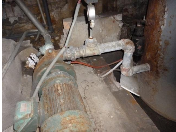
Imagen 5. Equipo de presión agua potable.

En la imagen 5 es posible ver el estado en el que se encuentra el equipo de bombeo. Tiene un alto grado de oxidación como también lo presenta el tanque hidroacumulador, las válvulas de succión y descarga del sistema en general, las tuberías y los accesorios en material hierro galvanizado. El estado de los anteriores elementos se pueden observar en las imágenes 6 y 7.