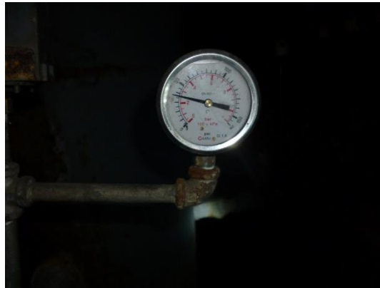
Imagen 8. Manómetro en la descarga del equipo de presión.

En el momento del levantamiento, el manómetro de la descarga del equipo indicaba alrededor de 35 psi en la entrada al hidroacumulador (ver imagen 8), pero éste último no tenía manómetro en la descarga, por lo que se desconoce la presión a la salida del equipo hidroacumulador.