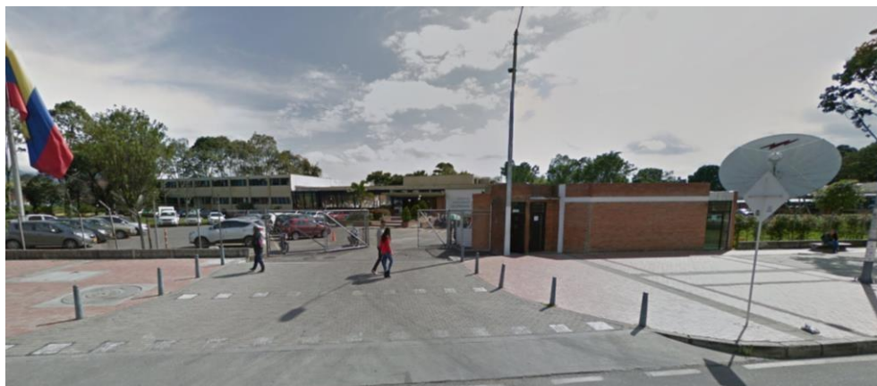
Imagen 1. Instalaciones Servicio Geológico Colombiano