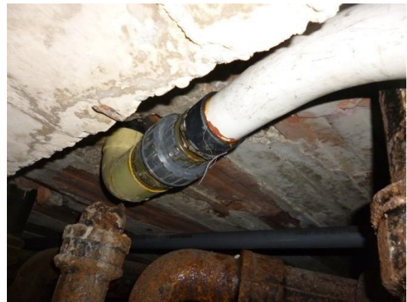
Imagen 30. Desagüe en PVC utilizando una universal para ser acoplado con tubería plástica para redes eléctricas.