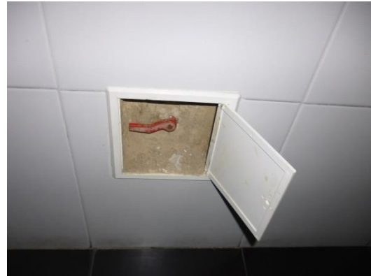
Imagen 16. Válvula tipo bola embebida en concreto.

Las válvulas que se muestran en las imágenes 15 y 16, son tipo bolas, las cuales no son adecuadas para controlar baterías de baños, dado a que son válvulas de cierre rápido y pueden generar el fenómeno de golpe de ariete en las conducciones.