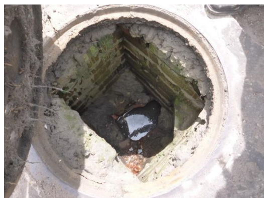
Imagen 45. Pozo de inspección del con obstrucciones.