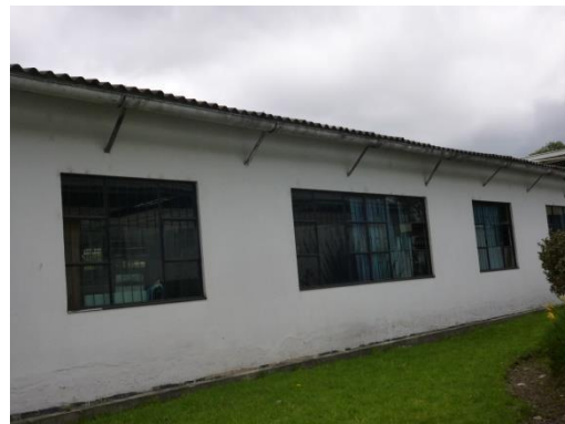
Imagen 41. Canal metálica que drena finalmente a calzada mediante una bajante en PVC.