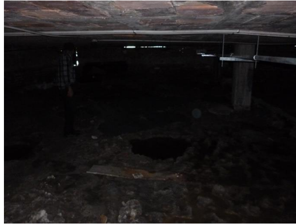
Imagen 33. Área del semisótano totalmente inundada.

lluvias, ya que el nivel freático en el campus generalmente está a un nivel más profundo que el semisótano del proyecto.