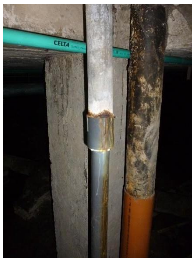
Imagen 11. Transición de material PVC a HG en mal estado.

siguientes imágenes. Actualmente el material hierro galvanizado no es especificado para la conducción de agua potable, lo establece los manuales de buenas prácticas de instalaciones hidráulicas por razones antes mencionadas.