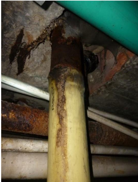
Imagen 27. Tubería en PVC quemada para acoplarse a HF.

Por otro lado es preciso ilustrar las reparaciones locativas que se han hecho en PVC, debido a las reparaciones de hace poco, y son tramos parciales ya que estos conductos se unieron a los existentes en HF y GRES de maneras inadecuadas, lo que ha generado fugas entre los acoples en los diferentes empates de tuberías, como se puede apreciar en las siguientes ilustraciones.