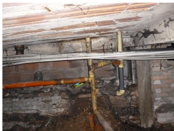
Imagen 34. Ventilación que descarga en semisótano.

ventilaciones debe estar aguas arriba de la descarga de los aparatos sanitarios.