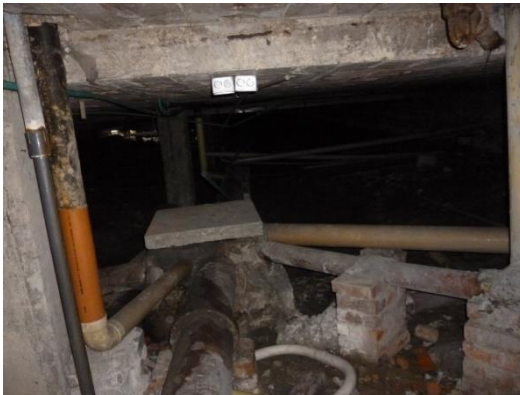
Imagen 31. Caja de inspección sin posibilidad de levantar su tapa.

Las cajas de inspección se encuentran también en mal estado, en ellas se hacen transiciones de diámetros mayores a menores, se encuentran selladas por cemento, y no tienen las dimensiones, ni la capacidad para para desaguar el sistema combinado, como se observan en las siguientes dos imágenes: