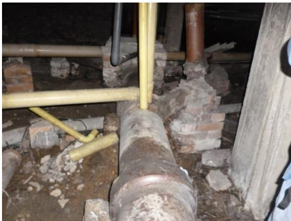
Imagen 29. Unión entre tubería PVC y GRES en mal estado.