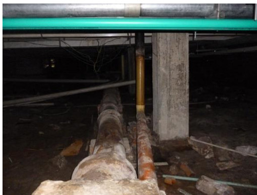
Imagen 25. Redes en GRES deterioradas.

De igual forma, en el piso técnico del edificio central se encuentran los colectores principales del sistema combinado en material GRES que tampoco presentan buen estado como se ilustra en las imágenes 27 y 28.