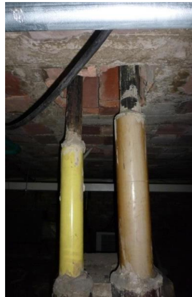
Imagen 38. Empate entre HF, PVC y GRES en mal estado.