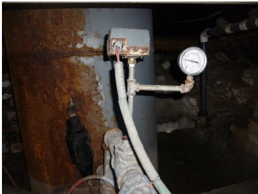
Imagen 6. Elementos del equipo de presión en mal estado.

En la imagen 5 es posible ver el estado en el que se encuentra el equipo de bombeo. Tiene un alto grado de oxidación como también lo presenta el tanque hidroacumulador, las válvulas de succión y descarga del sistema en general, las tuberías y los accesorios en material hierro galvanizado. El estado de los anteriores elementos se pueden observar en las imágenes 6 y 7.