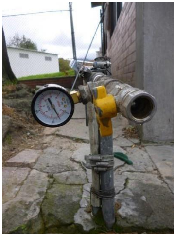
Imagen 17. Toma de presión poceta de aseo de primer piso.

Adicionalmente se hicieron una serie de toma de presiones en distintos puntos del edificio como se observa en las imágenes 17 y 18, con el fin de verificar el funcionamiento y comportamiento de los aparatos hidráulicos.