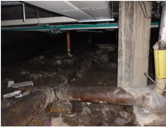
Imagen 37. Unión de bajante en HF con un tramo en PVC de mayor diámetro, con rotura en el codo y posterior empate a tubería en gres, completamente en mal estado.