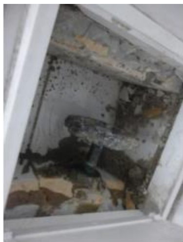
Imagen 13. Válvula embebida en concreto y oxidada.

Los registros de corte en el Edificio Central y de Administración de cada unidad sanitaria se encuentran en su mayoría deteriorados. En general las válvulas no dan el sello adecuado, están contenidas en el concreto, algunas no cuentan con la perilla para su manipulación, y para operarlas es complejo debido al estado de oxidación en el que se encuentran, como se ilustran en las siguientes imágenes: