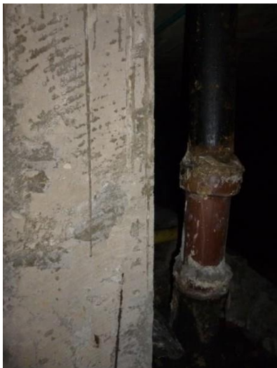
Imagen 39. Empate entre HF y GRES en mal estado.