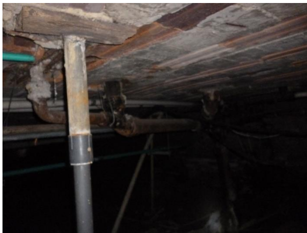
Imagen 12. Transición oxidada de material PVC a HG.

Los registros de corte en el Edificio Central y de Administración de cada unidad sanitaria se encuentran en su mayoría deteriorados. En general las válvulas no dan el sello adecuado, están contenidas en el concreto, algunas no cuentan con la perilla para su manipulación, y para operarlas es complejo debido al estado de oxidación en el que se encuentran, como se ilustran en las siguientes imágenes: