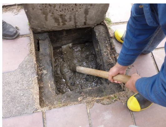
Imagen 47. Caja receptora de aguas lluvias totalmente colmatada.