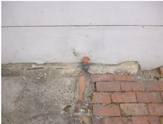
Imagen 3. Válvula de corte acometida.

Las válvulas tanto de llenado como de descarga y paso directo del sistema, son válvulas en hierro y asiento en bronce, de tipo paso directo y pesado, con uniones roscadas, las cuales se encuentran deteriorados, excepto unos pocos que se instalaron con las remodelaciones locativas que se han hecho de acuerdo a las necesidades que van resultando. En general las válvulas no dan el sello adecuado, y para operarlas es complejo debido al estado de oxidación en el que se encuentran o por las condiciones espaciales donde se encuentran, como se ilustran en las siguientes imágenes: