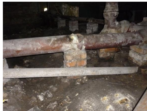
Imagen 26. Redes en GRES en mal estado.