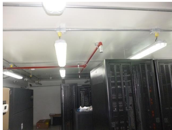
Imagen 51. Redes de extinción de incendio en data center del edificio central.

Éste tipo de sistemas es apropiado para zonas con equipamiento eléctrico, centros de transformación, salas de telecomunicaciones, salas de informática, centros de datos, y otras más aplicaciones. Además permite que los sistemas eléctricos y electrónicos sigan funcionando con normalidad y no afecta la salud de las personas en caso de descarga en presencia de personal.